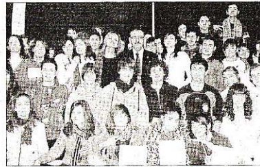
■ Los alumnos del IES Fuente Nueva al finalizar la charla.

La Asociación de Enfermos Renales y Donación de Órganos, Alcer, ha iniciado una serie de visitas por los institutos de El Ejido con el fin de concienciar a los jóvenes en materia de donación de órganos. La primera charla se ha llevado a cabo en el IES Fuente Nueva, donde han par-