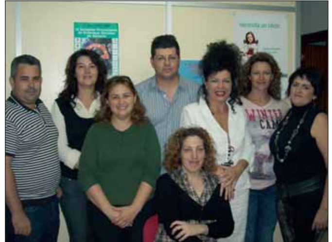
El equipo de profesionales que llevan a cabo este proyecto son personas que estaban hasta ahora en desempleo