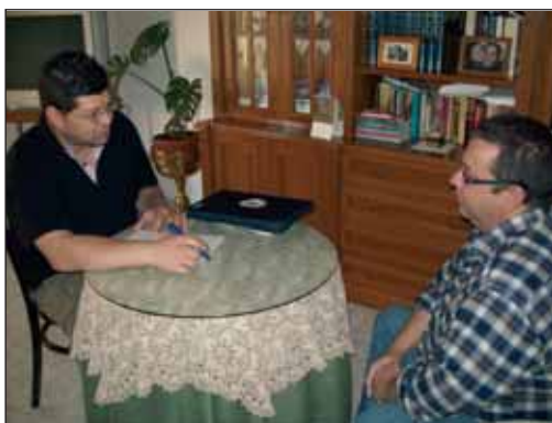
Las visitas del psicólogo son de gran ayuda

Dicho esto, si podemos tender nuestras manos para ayudar a otros, sólo os digo que en AL-CER las tenemos abiertas para que podáis recurrir a nosotros.