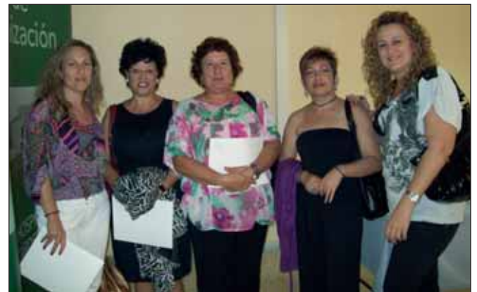
Enfermos renales y familiares acudieron a la cita