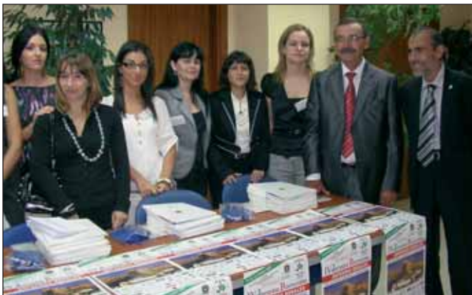
Los trabajadores de ALCER participaron en una mesa informativa