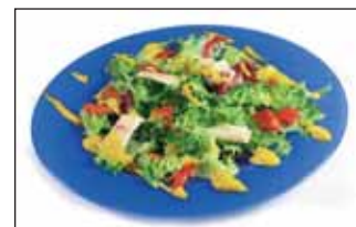
Ensalada de primavera

ta picada en juliana a remojo. Extender sobre una lechuga, escarola, zanahoria y cebolleta. Por último, para la vinagreta mezclamos miel, el vinagre y aceite, lo batimos y dejamos reposar.