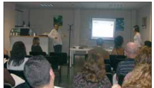
Un momento de las ponencias