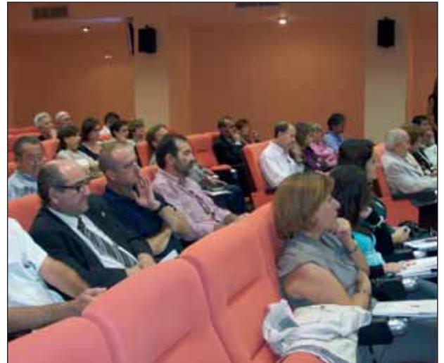
Las jornadas despertaron el interés de un público muy diverso