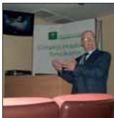
Antonio Osuna, nefrólogo responsable del primer trasplante vivo cruzado de España.