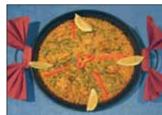
Arroz al horno

Elaboración: Limpiar la lechuga y la escarola y picar muy fina dejándola en el agua y sometiéndola a remojo cambiando el agua de vez en cuando. A la hora de preparar la ensalada secar muy bien la lechuga y la escarola y colocarlas en un bol. Añadir la zanahoria rallada bien enjuagada, y la cebolle-