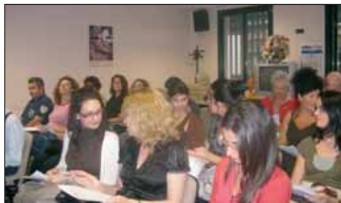
Las jornadas han despertado un gran interés