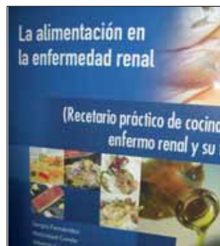
Precio de venta 15 euros para socios

En este libro hemos puesto una gran dosis de ilusión, porque creemos que es necesario que se pierdan algunos miedos infundados a comer y que se tenga cada vez un mayor conocimiento sobre la enfermedad renal y cómo se pueden ver afectada ésta por la alimentación y unos hábitos poco saludables.