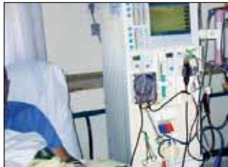
Máquinas de diálisis

La diálisis peritoneal domiciliaria es uno de los tres tratamientos renales sustitutivos junto a la hemodiálisis (en la que actualmente están cerca de 300 enfermos en la provincia) y el trasplante de donante vivo. A pesar de que el paciente puede, con la diálisis peritoneal, realizar el tratamiento en casa dos días a un centro de diálisis donde perder varias horas al día, este tratamiento es el más elegido.